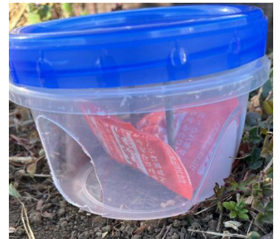
中にラットシード F